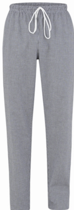
Q32 - Quadro nero