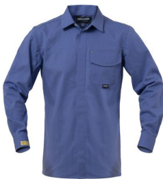
24 – CELESTE