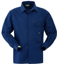
74 – SAILOR BLUE