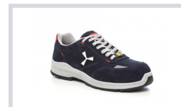
S0301 BLU NAVY