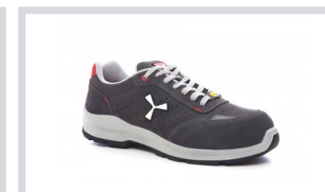
S1005 STEEL GREY