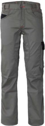
GY – GRIGIO/NERO

DESCRIZIONE Pantalone da lavoro multistagione, esclusivo elastico in vita, tessuto di rinforzo sul cavallo con tripla cucitura, chiusura alla patta con zip e bottone in cintura. Passanti rinforzati e travette a contrasto. Una tasca laterale con soffietto chiusa con aletta e velcro a sinistra, due tasche posteriori applicate chiuse con aletta e velcro, una tasca laterale multifunzione a destra, due tasche anteriori interne, taschino anteriore a contrasto e inserto laterale porta utensili, pences al ginocchio per il massimo comfort.