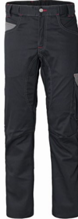
ZY – NERO/GRIGIO