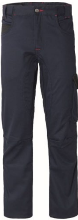
ZX – BLU/NERO