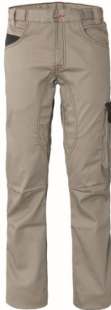
XA – BEIGE/NERO