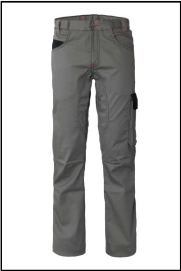
GY – GRIGIO/NERO