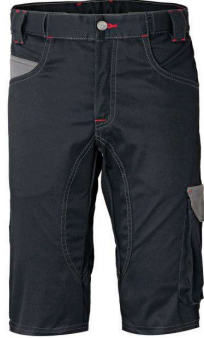
ZY – NERO/GRIGIO