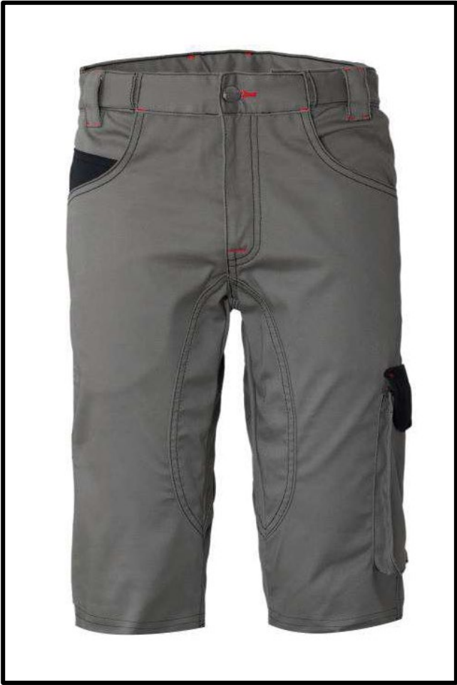
GY – GRIGIO/NERO