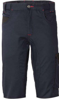
ZX – BLU/NERO