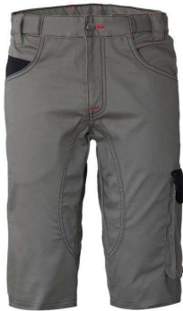
GY – GRIGIO/NERO

CE rossini. 1° categoria per rischi minimi