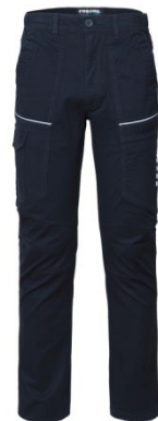
01 - BLU