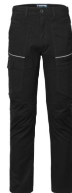
05 - NERO