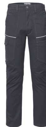
12 - GRIGIO