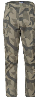
1C - CAMOUFLAGE