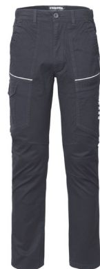
12 - GRIGIO