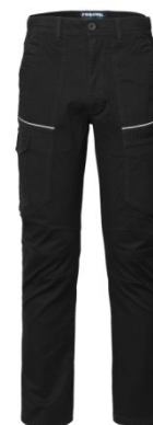
05 - NERO