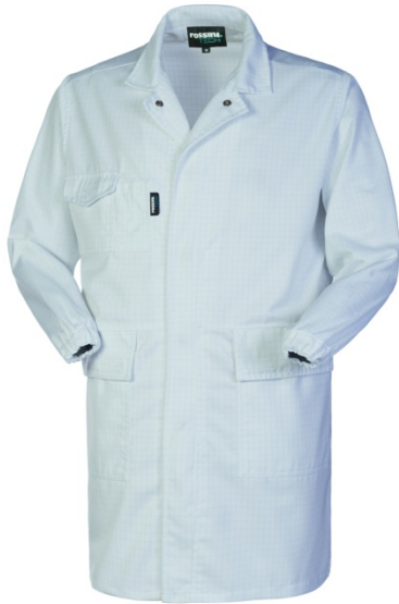
02 – BIANCO