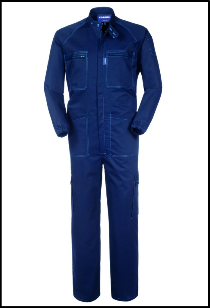
20 – BLU/CELESTE

Il margine di tolleranza produttivo, nel rispetto delle dimensioni della taglia, può essere del +/- 3%