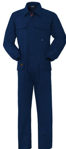
74 – SAILOR BLUE