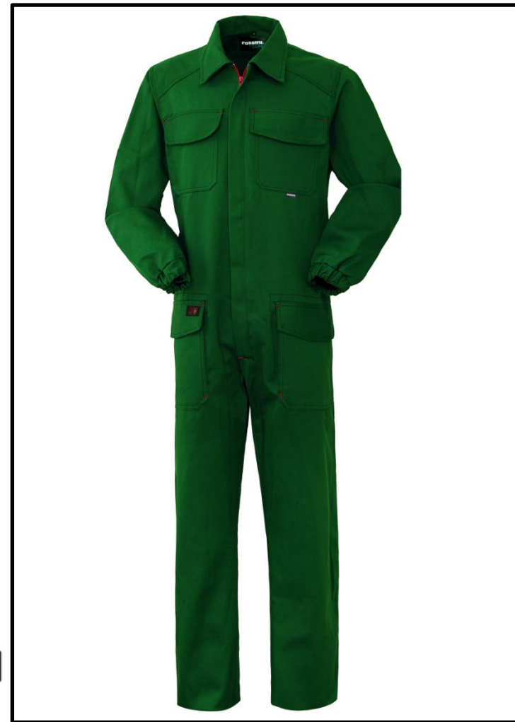
51 – BOTTLE GREEN

Il margine di tolleranza produttivo, nel rispetto delle dimensioni della taglia, può essere del +/- 3%