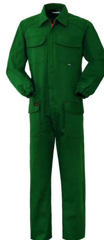
51 – BOTTLE GREEN