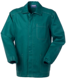
04 – VERDE