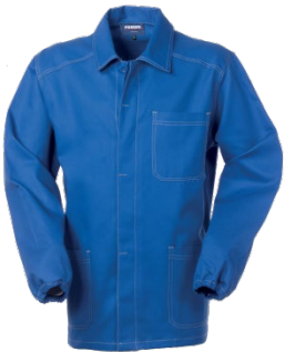
06 – AZZURRO ROYAL