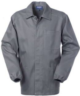
12 – GRIGIO