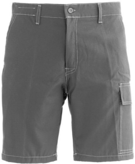
12 - GRIGIO