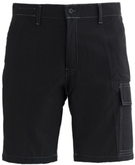
05 - NERO