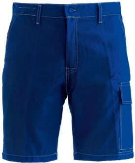
06 - AZZURRO ROYAL