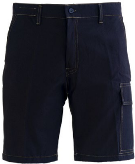
01 - BLU