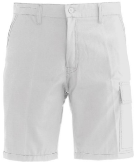
02 - BIANCO