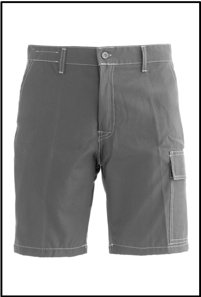
12 - GRIGIO