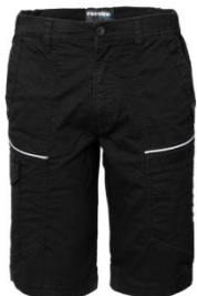
05 - NERO