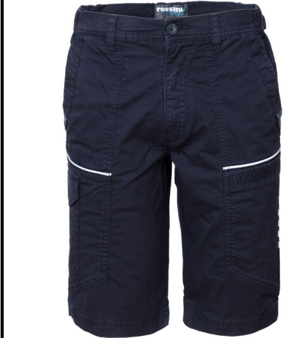
01 - BLU