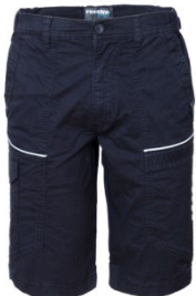
01 - BLU