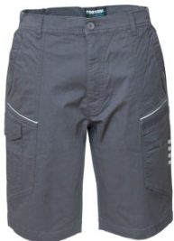
12 - GRIGIO