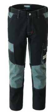
05 - NERO