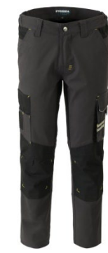
91 - WARM GREY