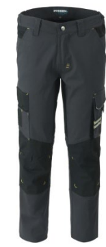
12 - GRIGIO