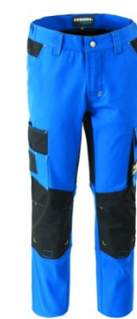
06 - AZZURRO ROYAL