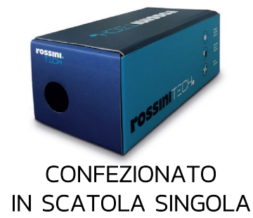
CONFEZIONATO IN SCATOLA SINGOLA

TESSUTO 98% cotone canvas 2% elastane Peso 270 g/m²