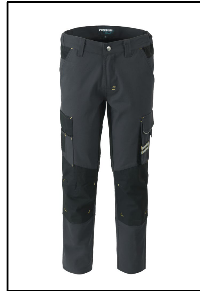
12 - GRIGIO