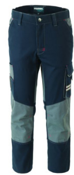
01 - BLU

CE ... 1° categoria per rischi minimi rossini. TECH