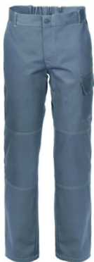
12 - GRIGIO