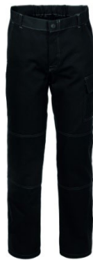
05 - NERO