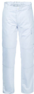
02 - BIANCO