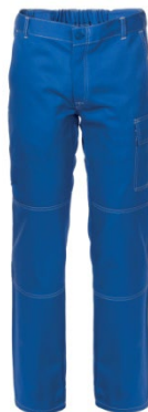
06 - AZZURRO ROYAL