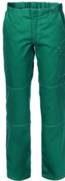
04 - VERDE