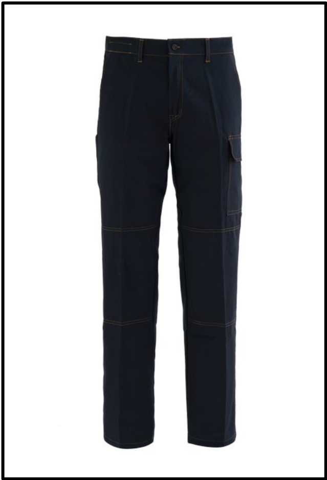
01 – BLU