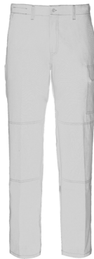
02 – BIANCO