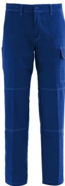
06 – AZZURRO ROYAL