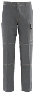
12 – GRIGIO