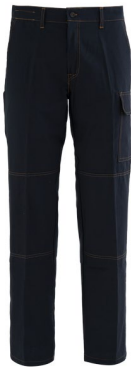
01 – BLU