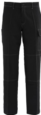
05 – NERO