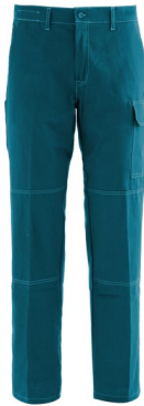
04 – VERDE